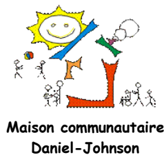
Maison communautaire Daniel-Johnson